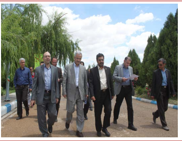
مدیر عامل شرکت مهندسی آب و فاضلاب کشور : اسفراین اولین شهر پاک استان در زمینه آب و فاضلاب است

بازدید معاون هماهنگی و پشتیبانی شرکت مهندسی آب و فاضلاب کشور از تصفیه خانه فاضلاب شهر بجنورد صفحه ۲ اخذ گواهی نامه ایزو ۱۷۰۲۵ سیستم مدیریت کیفیت توسط شرکت صفحه ۲ تصفیه خانه فاضلاب شهر اسفراین با اعتباری بالغ بر ۴۹۰ میلیارد ریال ارتقاء می یابد صفحه ۲ همزمان با ایام ماه مبارک رمضان پروژه آبرسانی به شهر صفی آباد وارد مدار بهره برداری شد صفحه ۳ اجرای بیش از ۳۰ برنامه در هفته صرفه جویی صفحه ۲ نشست مدیر عامل با برنامه سازان صدا و سیما استان صفحه ۲