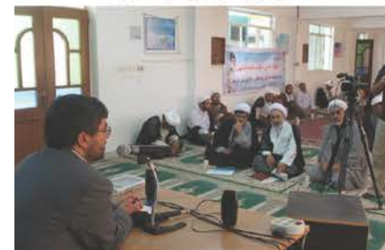
نشست ائمه جماعت شهر اسفراین با مشاور مدیر عامل