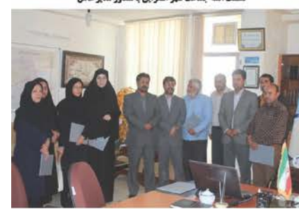
تجلیل از خبرنگاران فعال در حوزه آب و فاضلاب