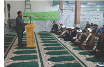
نشست مدیر عامل با امام جمعه و ائمه جماعت شهر آشنخانه