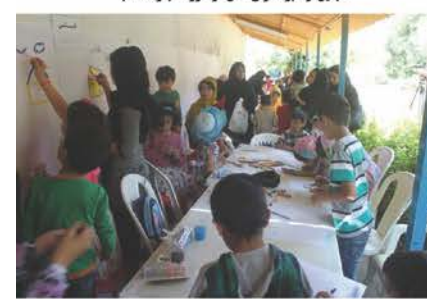
برگزاری جشنواره نقاشی در بجنورد