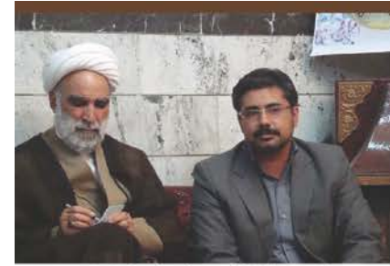
نشست مدیر عامل با امام جمعه و ائمه جماعت شهر شیروان